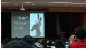
「台上一分鐘，台下十年工」