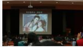
坤生與乾但(人物範例)