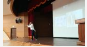
無動不舞 - - 身段美學 (現場表演)