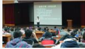
無動不舞 - - 身段美學 (文字介紹)